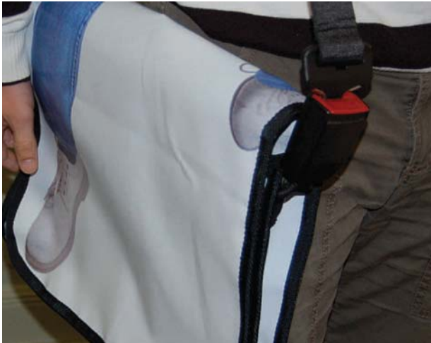
Droit et Devoir propose aussi une formation de « valoristes ». Les stagiaires y apprennent à valoriser ou recycler les vieux électroménagers, ordinateurs, bois et textiles. Comme cette sacoche fabriquée en récupérant une toile publicitaire et une ceinture de sécurité.

Droit et Devoir, on (p)répare les ordinateurs,